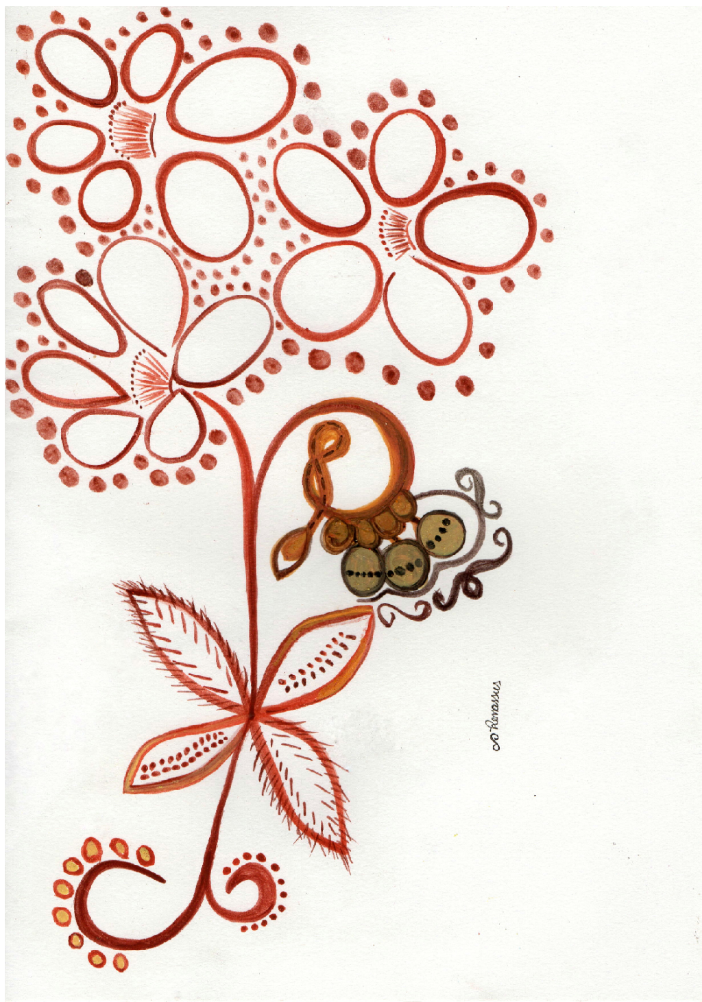
FIGURE 1 – Technologie Arouak, Renata Inahuazo, 2021, Pastel gras sur papier A3