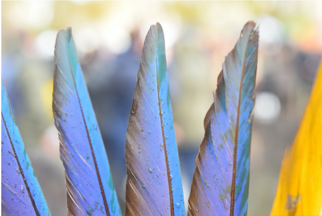
FIGURE 2

L'état chaotique du monde contemporain et de la gouvernance de sociétés si diverses de par leurs langues et spécificités, mais productrices de nombreuses connaissances partout sur la planète, et qui sont le siège d'expériences infinies et multifformes, nous contraint à réfléchir à nos orientations et à leurs modalités après cette année 2022 si critique. De là que nous devons revoir radicalement la façon dont nous avons géré l'espace mondial, les modalités qui prévalent dans l'établissement des rapports humains et notre manière de gérer toutes sortes de productions, dans des cadres et des systèmes politiques, économiques, sociaux, humains et environnementaux les plus divers. Au milieu de ce dérangement général, une évolution significative de l'organisation des communautés indigènes du Brésil est parvenue à s'imposer. En une époque caractérisée par une circulation mondiale devenue absolument concrète, où tant de populations migrent, se mélangent et où les civilisations se mêlent, les peuples dits originaires revendiquent leurs ancêtres et