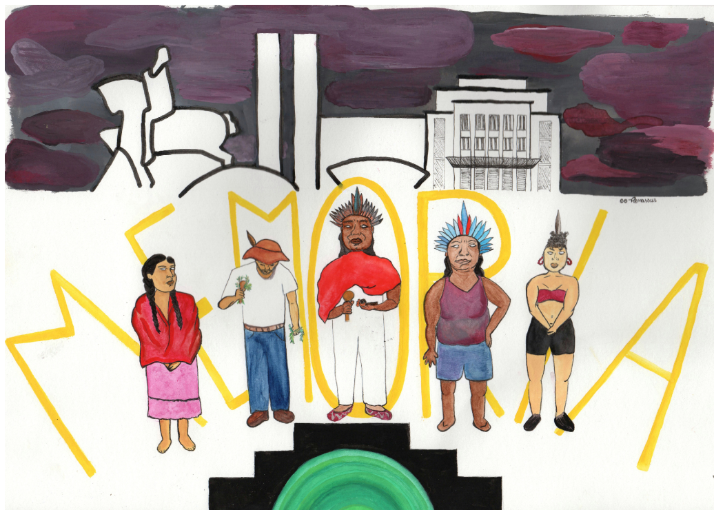
FIGURE 10 – Continuité, Renata Inahuazo, 2021, Aquarelle et stylo feutre pigmentée sur papier A3