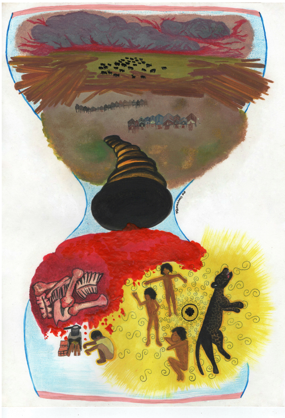
FIGURE 13 – Quando o tempo é dinheiro, Renata Inahuazo, 2021, Pastel gras sur papier et encre pour tissus sur papier A3