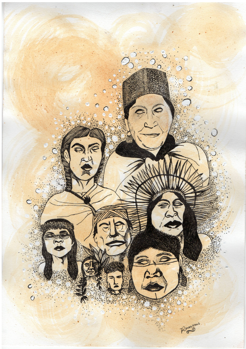
FIGURE 12 – Pas ancestral, Renata Inahuazo, 2021, stylos feutre pigmentée et roucou sur papier A4