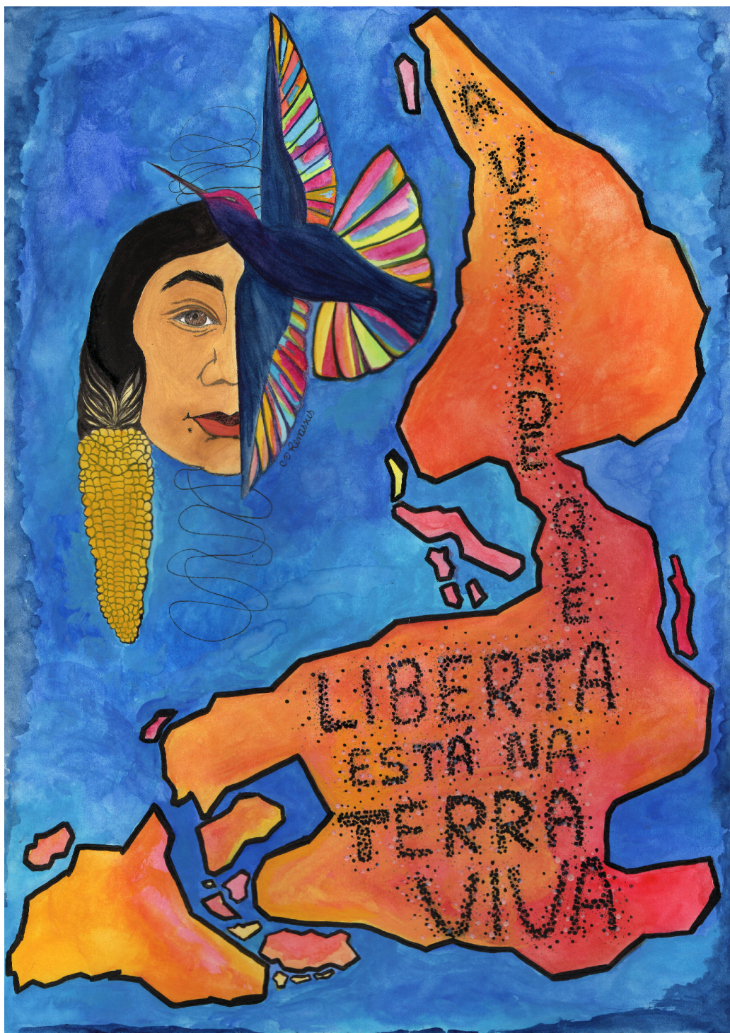
FIGURE 11 – Terre vivante, Renata Inahuazo, 2021, Aquarelle, encre de Chine et peinture pour tissu sur papier A3