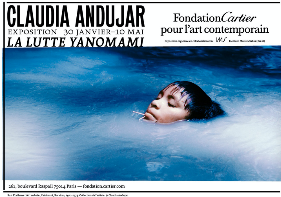
FIGURE 8 – Affiche de l'exposition La lutte Yanomami, présentée à la Fondation Cartier, à Paris, du 30/01 au 10/05/2020 ; réouverture du 16/06 au 13/09/2020.

L'exposition d'Andujar a encore accentué le désir d'entreprendre la lecture du livre initiatique écrit par Davi Kopenawa et l'anthropologue français Bruce Albert, La chute du ciel. Paroles d'un chaman yanomami , né des récits de Kopenawa à l'ethnologue, dans sa langue maternelle, retraçant sa trajectoire personnelle, de la découverte de sa vocation de chaman dans l'enfance, à l'avancée dévastatrice de l'homme blanc dans la forêt, en passant par sa lutte et ses voyages à l'étranger, s'efforçant de dénoncer la barbarie et de défendre son peuple.