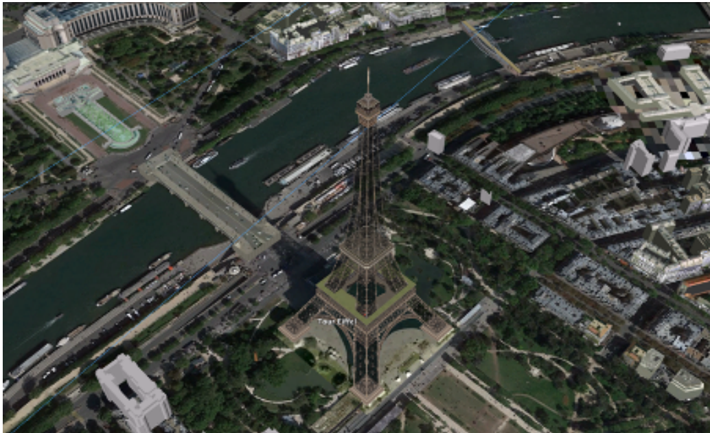
FIGURE 3 – Capture d'écran montrant une vue Google Earth de la Tour Eiffel avec l'option « Bâtiment 3D » cochée.

en mosaïque mais suivant l'exemple, canonique, de la première bille bleue. Ainsi, lorsque Google a mis à disposition du grand public en 2005 son programme de vision satellitaire Google Earth et que c'est à ce même moment qu'a commencé à se démocratiser dans nos usages quotidiens le GPS, donc la géolocalisation, nous étions déjà préparés par des années d'imagerie cartographique à accueillir cette révolution des représentations de la terre, sans comprendre qu'il n'y aurait pas de retour en arrière dans notre manière de nous figurer le monde. Le rapport inversé, évoqué plus haut, dans la représentation que l'on se fait des différences entre dessin et photographie a fini par être totalement annulé par les actuelles vues par satellite de Google Earth. En effet, le dessin, en dehors de la carte, agit également par-dessus l'image à travers les reconstitutions tridimensionnelles (fabriquées initialement grâce au logiciel Sketchup) des bâtiments et reliefs aujourd'hui créées par des algorithmes à partir, entre autres, d'images Google Street View (voir Fig. 3).