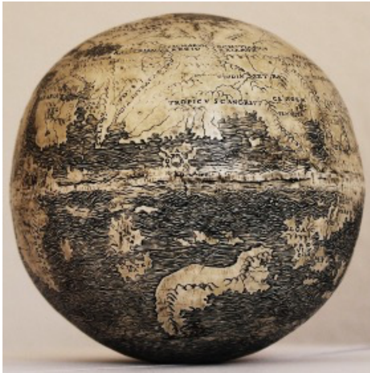
FIGURE 2 – Globe terrestre, 1504, Florence. Gravure et peinture sur deux moitiés inférieures d’œuf d’autruche, collection particulière.

Mais cette vision portée sur les cartes de cette époque est anachronique, trop influencée par la cartographie subjective du XX e siècle ; les conquérants de la Renaissance, eux, voulaient des cartes précises, des outils de la colonisation et pour cela, il fallût que les mathématiciens inventent les projections cartographiques dont la première fut celle de Mercator qui, en 1569, posait, sans le savoir, les premiers jalons de l'image composite cartographique.