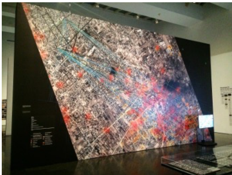
FIGURE 4 – Forensic Architecture, Rafah, vendredi noir 1er août 2014. Vue de l'expo du MACBA, Barcelone, été 2017. 8

entier (voir Fig. 4). Récemment, le collectif a fait parler de lui suite à la reconstitution de la scène de la supposée « mort accidentelle » de Zineb Redouane après un tir de grenade lacrymogène lors de la troisième mobilisation des Gilets jaunes à Marseille le 1er décembre 2018 6 .