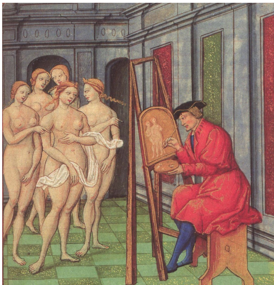
FIGURE 1 – Zeuxis peignant les filles de Crotona, Enluminure tirée du manuscrit du Roman de la rose, 1525. New York, The Pierpont Morgan Library.

On connaît le commentaire d'Alberti dans De Pictura (2019) qui fait de cette histoire un exemple du bon jugement de l'artiste ne se fiant ni à son imagination ni à la simple représentation de la nature jugée trop imparfaite. L'image idéale de beauté se situe ainsi au-delà de l'imitation de la nature et même au-delà d'une image idéale puisqu'elle ne trouve pas non plus de source dans la seule inspiration de l'artiste. La peinture apparaît donc comme une opération mentale, fondée sur la capacité de choisir et de recomposer. Elle place le peintre dans une situation interlope entre capacité à analyser la réalité et capacité d'invention par l'imagination, quelque part, dit Alberti,