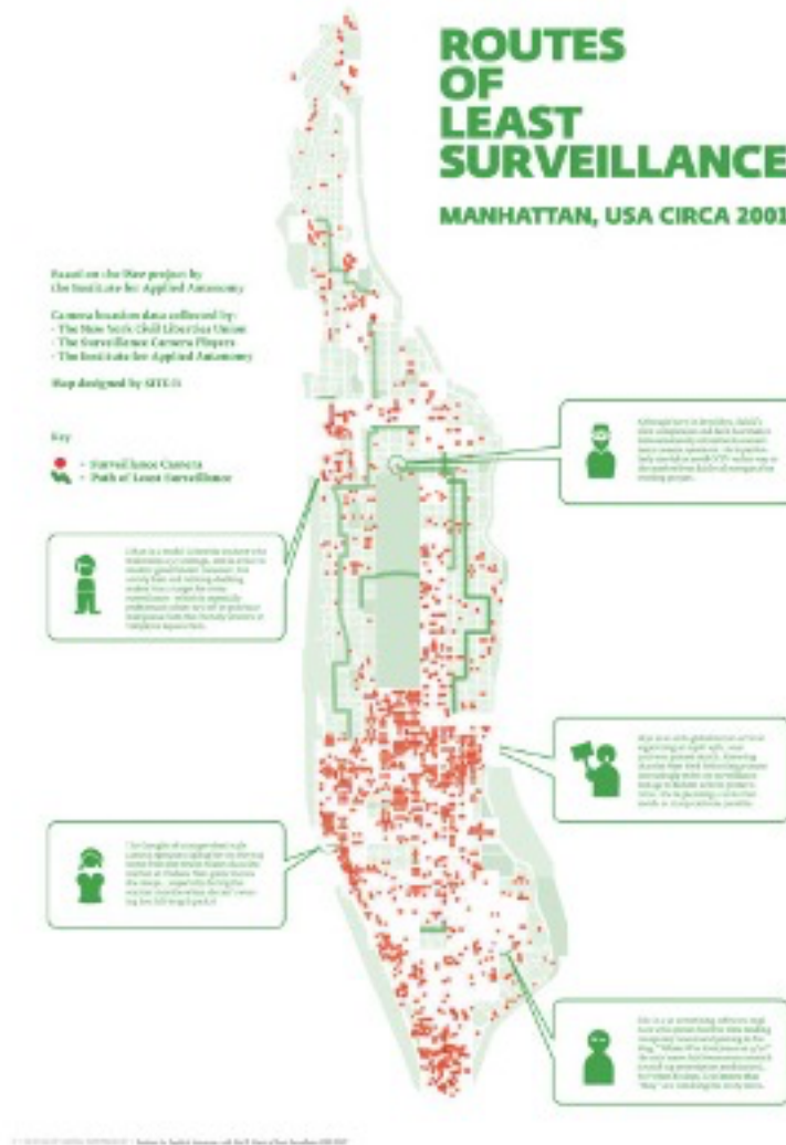
FIGURE 6 – Institute for Applied Autonomy, Routes of Least Surveillance, Manhattan, USA, CIRCA 2001. Carte reproduite dans An Atlas of Radical Cartography (2008).

On le sait, les technologies de surveillance ont beaucoup gagné en sophistication pendant ces dernières années, jusqu'à l'ultime invention de la reconnaissance faciale dont certaines start-up zélées sont déjà en train d'exploiter les algorithmes qui nous renvoient aux pires heures de la classification physiognomonique. Selon Giorgio Agamben (2014, 48-49), aux yeux de l'autorité